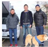
昨年の福井視察より

●変わる事、変わらない事、どちらも大事なのかもしれません。今年も、創業以来続いているオープン記念の粗品「淡路のワカメ」をご用意しています♪