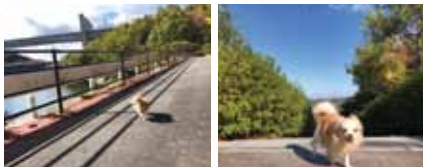
映えスポット①防災公園(左) ②吞吐ダム(右)

よ。僕は、散歩に夢中で景色には興味はないけど、パパは「映えスポット」で写真を撮ろうといつも頑張っているよ。上手に撮れています？