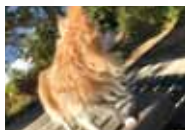
これは撮影失敗!(汗)

よ。僕は、散歩に夢中で景色には興味はないけど、パパは「映えスポット」で写真を撮ろうといつも頑張っているよ。上手に撮れています？