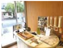
リニューアル前の様子

ブラックはダークカラーや白髪の色になる方へ 👉 シャンプーとトリートメントの両方ございます! 色持ちを良くしたい方は是非ご検討ください ♪