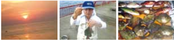
平磯釣り公園の朝日(左)この日の大物グレ25cm(中)この日の釣果(右)

海の釣りでは、この時期いろんな魚が釣れ、食べても美味しいので、釣り人にとって一番楽しい季節です。「1場所・2餌・3仕掛」という釣りの格言がありますが、エサ取りの名手「カワハギ」を釣る時は、取られにくいアサリのむき身を使うこともあります。