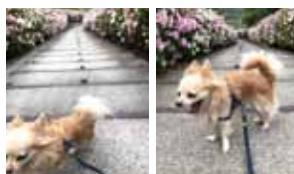
(左)失敗!からの (右)ベストショット!

コロンは6才。人間の年齢でいうと40才だそうです。元気いっぱいです。公園に散歩に行っても走り回っています。インスタや新聞用の写真を撮ろうとスマホを構えても、逃げてしまいます。けど、ま、いつか。