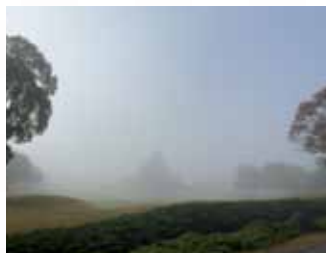
霧でかすんだスタートホール