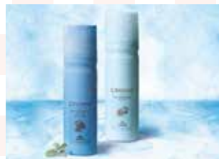
氷点下炭酸泡フローズンケア